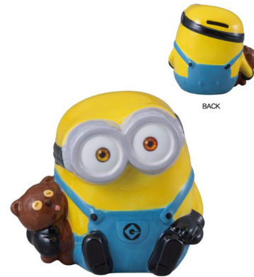
SAN3332 貯金箱 / ミニオン / BOB size W13.5XD10XH12.5(cm) 本体価格 ¥1,800