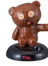
SAN3466 ペンスタンド / ミニオン / TIM size W6.5XD6.2XH7.8(cm) 本体価格 ¥1,680