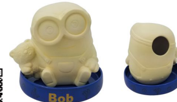
SAN3468 加湿器 / ミニオン / BOB size 本体 W12XD9XH10.3 皿Φ11.5XH1.8(cm) 本体価格 ¥2,000 *セット内容 / 本体(1)+皿(1)