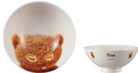
SAN3350-2 キャラクター茶碗 / ミニオン / TIM size Φ12XH5(cm) 本体価格 ¥800