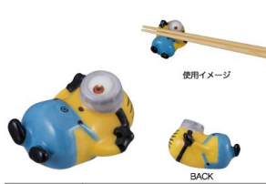
SAN3336-2 立体箸置き / ミニオン / STUART size W3.7XD3.5XH3(cm) 本体価格 ¥880