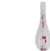
SAN3351-3 キャラクターレンゲ / ミニオン / FLUFFY size W4.5xD13.3xH4(cm) 本体価格 ¥480