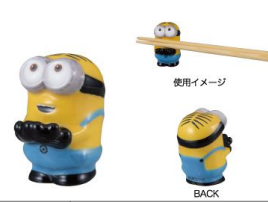
SAN3336-3 立体箸置き / ミニオン / DAVE size W2.6XD3.6XH4(cm) 本体価格 ¥880