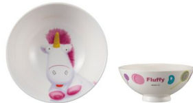
SAN3350-3 キャラクター茶碗 / ミニオン / FLUFFY size Φ12XH5(cm) 本体価格 ¥800