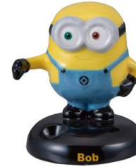
SAN3465 ペンスタンド / ミニオン / BOB size W6.8XD6.4XH7.8(cm) 本体価格 ¥1,680