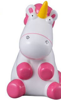
SAN3358 貯金箱 / ミニオン / FLUFFY size W9xD6xH13.5(cm) 本体価格 ¥1,800