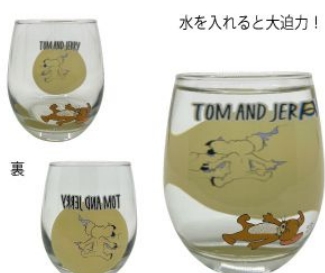
水を入れると大迫力!