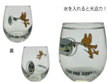
水を入れると大迫力!