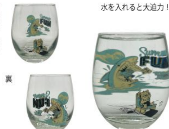
水を入れると大迫力!