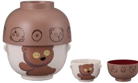
SAN3337-2 汁椀茶碗セット ミニ / TIM size 茶碗Φ9XH6 汁椀Φ10XH5.7(cm) 本体価格 ¥1,580