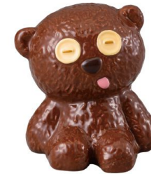
SAN3333 貯金箱 / ミニオン / TIM size W8xD7xH10(cm) 本体価格 ¥1,800