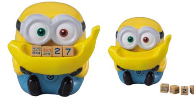
SAN3467 万年カレンダー / ミニオン / BOB size W9XD9.5XH8.8(cm) 本体価格 ¥2,000 *セット内容 / 本体(1)+カレンダー(4)