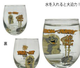
水を入れると大迫力!