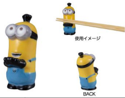
SAN3336-1 立体箸置き / ミニオン / KEVIN size W2.2XD3.5XH5.9(cm) 本体価格 ¥880