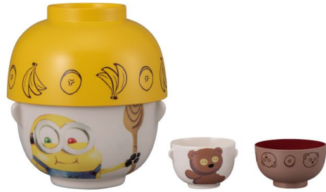
SAN3337-1 汁椀茶碗セット ミニ / BOB size 茶碗Φ9XH6 汁椀Φ10XH5.7(cm) 本体価格 ¥1,580