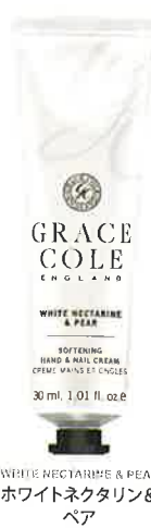
WHITE NECTARINE & PEAR ホワイトネクタリン& ペア