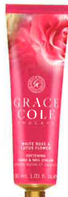
WHITE ROSE & LOTUS FLOWER ホワイトローズ& ロータスフラワー