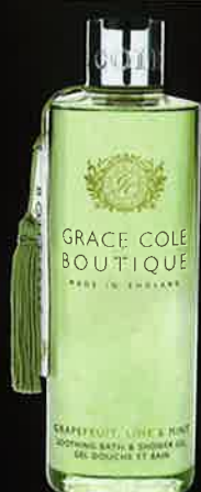
GRAPEFRUIT, LIME & MINT グレープフルーツ ライム&ミント