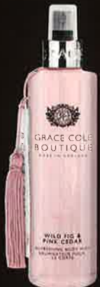
WILD FIG & PINK CEDAR ワイルドフィグ&ピンクシダー