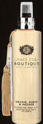
ORCHID, AMBER & INCENSE オーキッド アンバー&インセンス