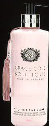
WILD FIG & PINK CEDAR ワイルドフィグ&ピンクシダー