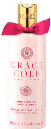
WHITE ROSE & LOTUS FLOWER ホワイトローズ& ロータスフラワー