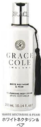
WHITE NECTARINE & PEAR ホワイトネクタリン& ペア

容量:30mL 商品サイズ:W39×H114mm 価格:¥800(税抜) ケース入数:24