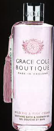
WILD FIG & PINK CEDAR ワイルドフィグ&ピンクシダー

容量:500mL 商品サイズ:H200×65Φmm 重さ:570g 価格:¥1,200(税抜) ケース入数:24