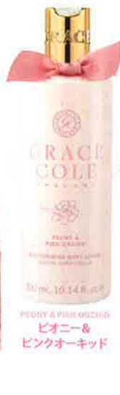
PEONY & PINK ORCHID ピオニー& ピンクオーキッド