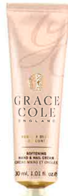
VANILLA BRUSH & PEONY バニラブラッシュ& ピオニー