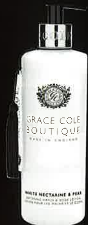
WHITE NECTARINE & PEAR ホワイトネクタリン&ペア

容量:500mL 商品サイズ:H210×65Φmm 重さ:520g 価格:¥1,500(税抜) ケース入数:24