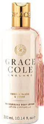
VANILLA BRUSH & PEONY バニラブラッシュ& ピオニー