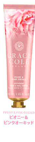
PEONY & PINK ORCHID ピオニー& ピンクオーキッド