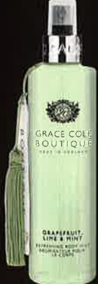
GRAPEFRUIT, LIME & MINT グレープフルーツ ライム&ミント