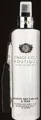
WHITE NECTARINE & PEAR ホワイトネクタリン&ペア