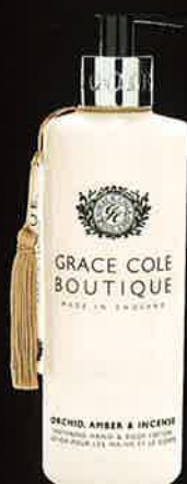
ORCHID AMBER & INCENSE オーキッドアンバー&インセンス