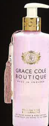
ENGLISH ROSE & CHAMPAGNE イングリッシュローズ&シャンパン