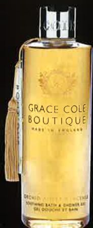
ORCHID AMBER & INCENSE オーキッドアンバー&インセンス