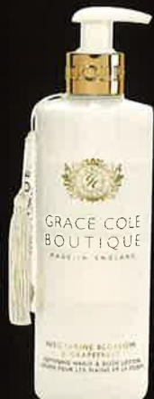
NECTARINE BLOSSOM & GRAPEFRUIT ネクタリンプロッサム&グレープフルーツ